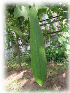
理科教材の畑のへちま